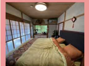
文殊の間 トリプルベッド