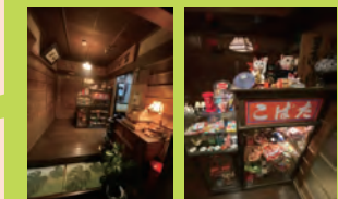
玄關ロビー 駄菓子屋