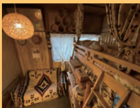
ロッジの間 2段ベット