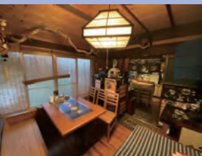
浜辺の間 食堂スペース